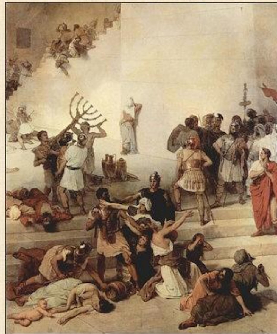
主後70年羅馬平亂，攻打耶路撒冷，毀壞聖殿